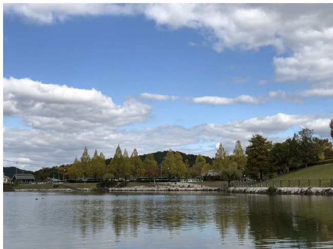
図1.調査対象地である岡山県赤磐市尾谷の山陽ふれあい公園内の民潤池

調査地は岡山県赤磐市尾谷の山陽ふれあい公園内に位置する民潤池と呼ばれるため池で行った(図1)。民潤池の周囲を3つのエリアに分けて、それぞれのエリアに14種類の餌の入ったカメ網を設置した。民潤池ではハスが群生していたが、2010年頃から減少し始めた。その頃から民潤池ではアカミミガメなどの淡水ガメが多く確認され、ハス減少の原因としてはアカミミガメによる食害ではないかと考えられる。現在ではハスは消滅し、大量のアカミミガメやクサガメが生息している。ため池の周囲はコンクリートで固められた人工護岸となっている。