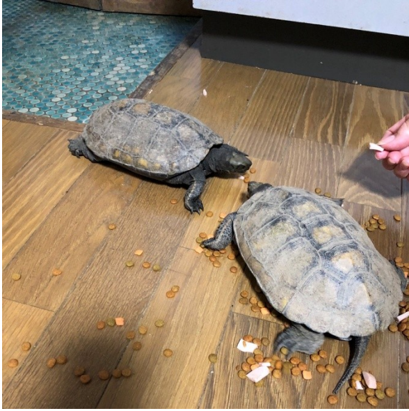
図2. 「カメ子」とともに、庄島家に現れた2匹のニホンイシガメたち (2021年). 写真左上が毎年カメたちが屋内に入ってくる土間.

「(毎年現れているのは)同じ個体だと思う. 動作がけそけそしとらん(落ち着いている)もんね」と断言する. さらに「いつも夏になるとカメ子が帰ってくるのが楽しみ. 同居する娘と『今年も帰って来たね, お帰り』といって出迎えている」とすっかり家族のような存在になっている.